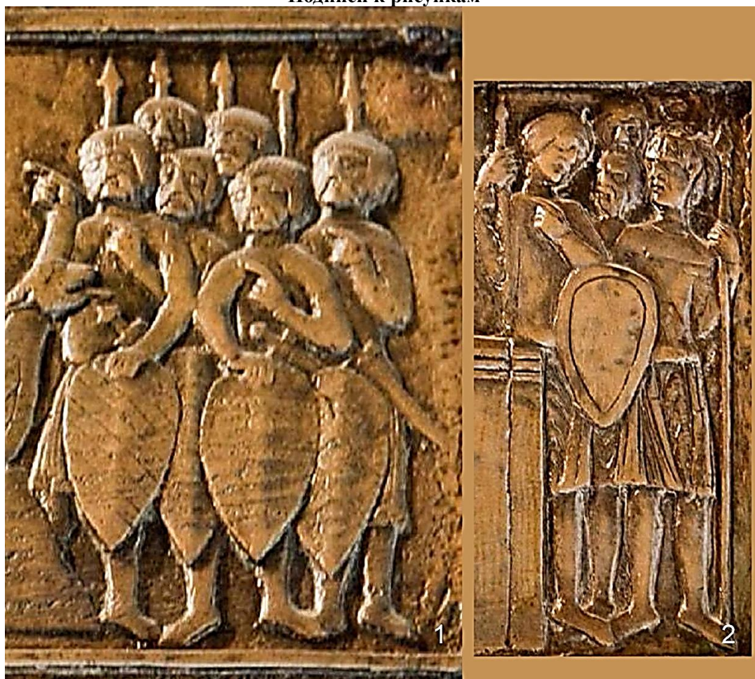
Рис. 1. Прусы на рельефах Гнезненских врат: 1 – Сцена 10. Прибытие Св. Войцеха в Пруссию; 2 – Сцена 13. Богослужение перед алтарём [7, рис. 2].