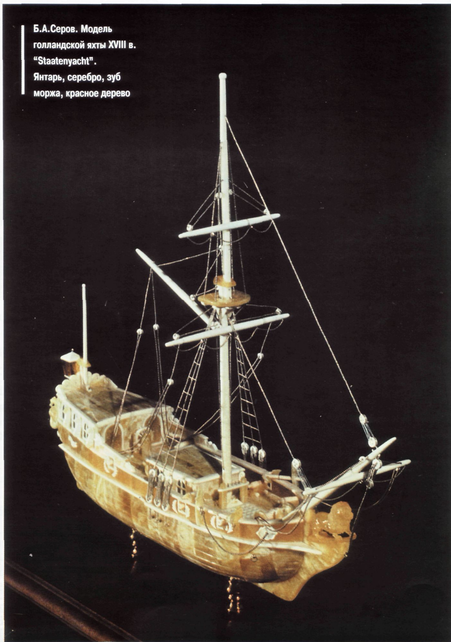
Б.А.Серов. Модель голландской яхты XVIII в. "Staatenyacht". Янтарь, серебро, зуб моржа, красное дерево

Своеобразным связующим звеном между старой немецкой школой и современными калининградскими художниками стали масте-