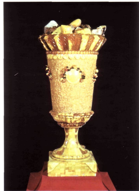
Ваза "Изобилие". Высота 1 м 5 см. Калининградский янтарный комбинат. 1954 г. Находится в Калининградском музее янтаря

Наряду с массовой продукцией художники комбината создавали крупногабаритные изделия, в которых отразилось свойственное советскому искусству тяготение к монументализму. Образцом такого помпезного стиля стала огромная, в метр высотой, ваза "Изобилие", богато декорированная медальонами с гирляндами в виде ягод и фруктов из окрашенного янтаря. А самым знаменитым