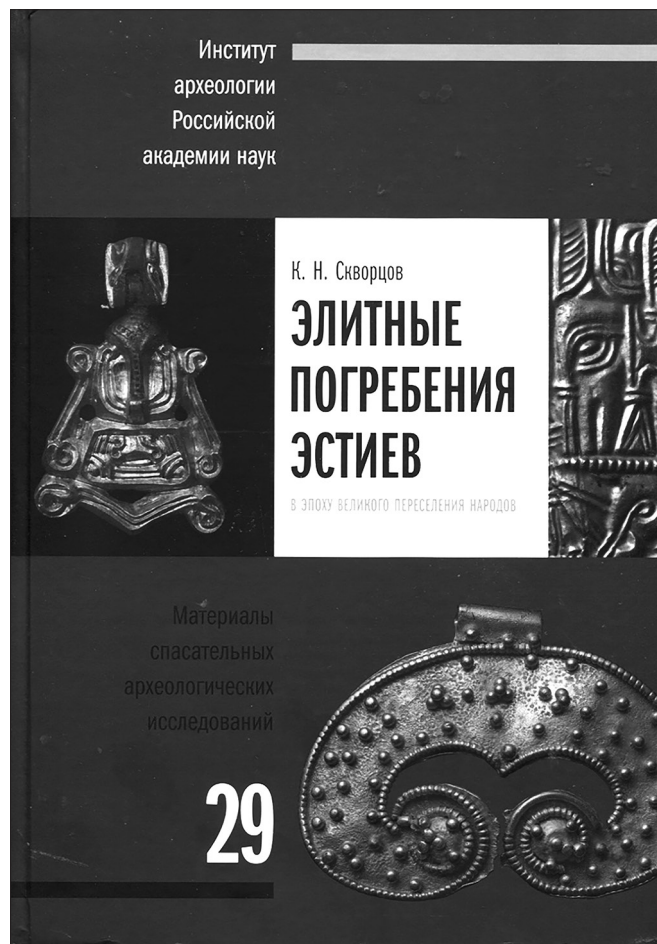
Рис. 1. Обложка книги К.Н. Скворцова «Элитные погребения эстиев в эпоху Великого переселения народов...».

Глава 6 включает материал могильника Kleinheyde/Гурьевск , частично раскопанный в 1995-1997 гг. авто-