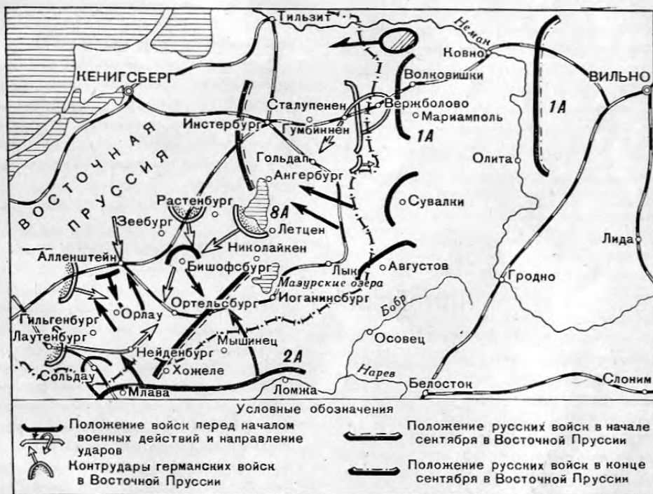
Схема 2. Восточно-Прусская операция.

Между тем русское командование не воспользовалось создавшейся возможно-