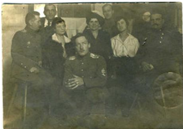
Русские «белые» эмигранты в Германии.

ворные отношения с немецким лагерным начальством. Так, в лагере Зальцведель 1 , в котором, по приезду в конце октября 1920 г. свои «порядки» наводил Г. Гай 2 , первоначально «во главе стояло немецкое командование, только командиры рот были русские, в большинстве бывшие офицеры. Они подчинялись немцу – командиру блока, тот коменданту...». Красноармейцы были разделены на «компании», или роты, по 500 человек, и «делилась побарачно на 4 части, где имелся старший барака, отвечавший за порядок и за своих 125 человек» 3 . В лагере Пархим, пока «Бюро не имело указаний о том, сохранять ли военную организацию, красноармейцы выбрали комитет из пяти человек, из которых только двое причислили себя к коммунистам» 4 .