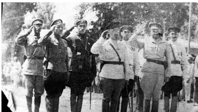
Командование 4 армии (предположительно).

Ведение войны с регулярной армией государства, имевшего более жизнеспособную идеологию, чем «белое» движение, потребовало срочного преобразования воинских частей Красной армии. Командующий армиями Западного фронта доносил в июне 1920 года Главкому: «Некомплект командного состава доходит до 28%. ... Одних генштабистов до 80% не хватает