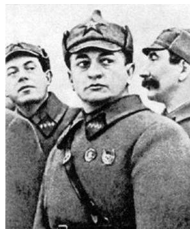
Командующий Западным фронтом М.Н. Тухачевский

Красная армия оперировала на Польском направлении двумя фронтами – Западным (командующий М.Н. Тухачевский) и Юго-Западным (командующий А.И. Егоров). В связи с недостаточным комплектованием боевых частей наступление развернуть не удавалось. Тухачевский пополнял армию любыми способами, от розыска дезертиров до включения в состав боевых частей пленных бело-гвардейцев и перебежчиков.