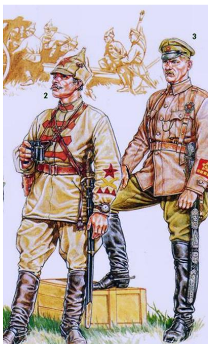
Форма красных командиров и комиссаров. (Современная реконструкция)

«мировой революции», и могла оказать военную и моральную помощь немецким коммунистам 1 .