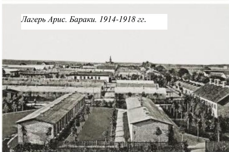
Лагерь Арис. Бараки. 1914-1918 гг.

Отступление Красной армии для европейских обывателей было совершенно неожиданным, и, видимо, поэтому, когда появились первые сведения о переходе красноармейскими частями границы, в западных газетах появилась такая информация: «6-7 тысяч русских перешли через немецкую границу и направляются к Нейденбургу 3 . Они желают захватить концентрационный лагерь, где уже находится 2 тысячи поляков» 4 .