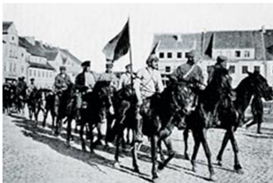
Красная Армия входит в немецкий город Зольдау, отошедший по Версальскому договору к Польше.

От многого (швейных машинок, граммофонов и других предметов невоенного назначения) красноармейцы вынуждены были избавиться, отправляясь на Западный фронт. Там «зажиточные», отягощенные трофеями части были лишены и другого «излишнего имущества»; им было предложено поделиться обмундированием, вооружением и запасами продовольствия с другими частями 3 .