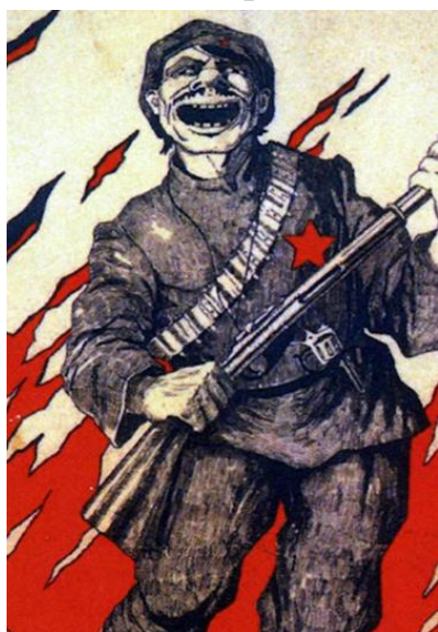
«Красноармеец» (с польского плаката)

Транспортировка осуществлялась как морским путем, так и железной дорогой по так называемому «Данцигскому коридору» (по договоренности с Польшей). Интернированным «выдали на дорогу по полфунта хлеба и банке консервов. Разбили на партии для отправки, разные части направлялись в разные города» 1 .