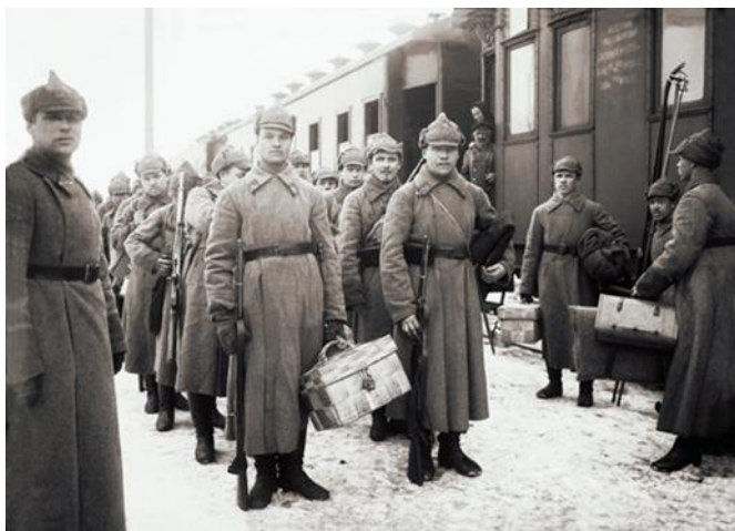
Отправка красноармейцев из Архангельска

Польская война была, по сути, первой войной армии Советской России с «внешним» неприятелем, когда в одном строю оказались вчерашние против-