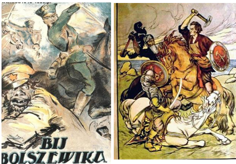
Польские и советские пропагандистские плакаты периода Советско-польской войны

По мнению политкомиссара одной из бригад корпуса Гая, дававшего пояснения сотруднику Реввоенсовета о «пленении корпуса», поляки специально устроили такую ловушку: «тов. Гай, увлеченный движением вперед, не заметил, что его умышленно загоняли в коридор, да-