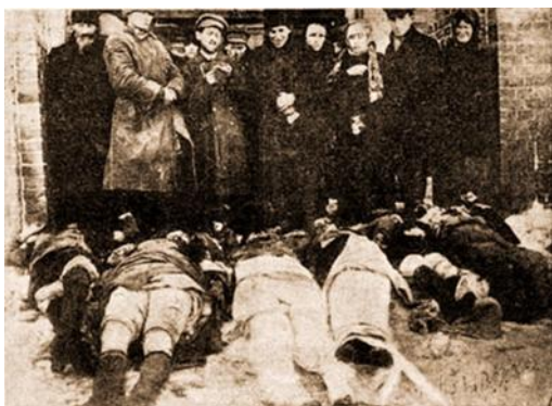
Жертвы резни еврейского населения. Польша, 1919-1920 гг.