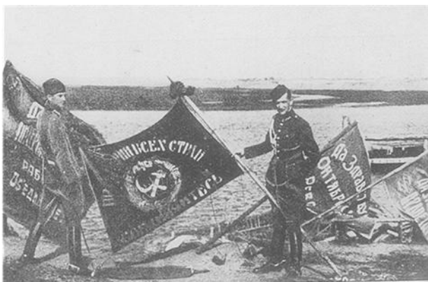
Польские солдаты демонстрируют трофейные знамена красноармейских частей

в годы Первой мировой войны всеми воюющими сторонами создавались национальные воинские части из поляков. Так, Польша могла рассчитывать на помощь боеспособных польских частей, которые были сформированы в армиях Антанты.