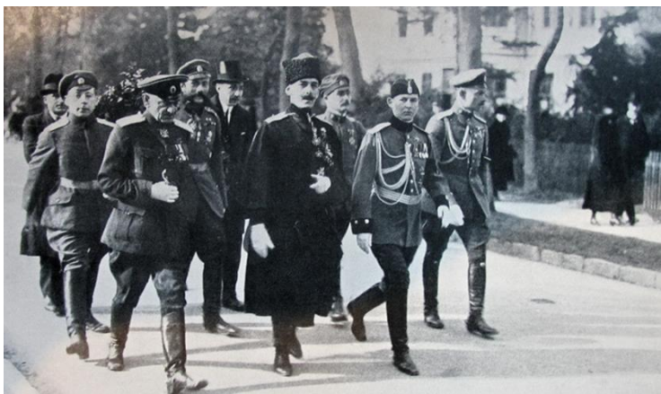
П.В. Бермонд-Авалов со своими офицерами. Германия, 1921 г.

добровольцев в белые армии 1 . Во время пребывания красноармейцев за границей происходили события в Кронштадте, что также повлияло на идеологическое «размежевание». В условиях жажды со стороны интернированных любых новостей, своими газетами бесплатно снабжали их эмигрантские организации. По воспоминаниям интернированного политработника, «получение газет “Голос России” и “Воля России” с первых дней интернирования сильно содействовало антисоветской пропаганде, которая также началась с первых дней интернирования. Та наглая ложь, которую проповедовали эти газеты, ввела многих в заблуждение. В результате антисоветской пропаганды мы имели в лагере 100-150 человек определенных контрреволюционеров, со стороны которых не раз видели резкие выступления» 2 .