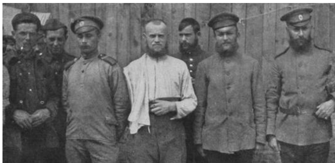
Русские военнопленные в Германии.

Возможно, истинные слова представителей советской власти в пересказе были искажены. Это следует хотя бы потому, что инструкция из Москвы четко рекомендовала «не разжигать» классовые страсти в красноармейской массе, а также не допускать участия в немецком революционном движении.