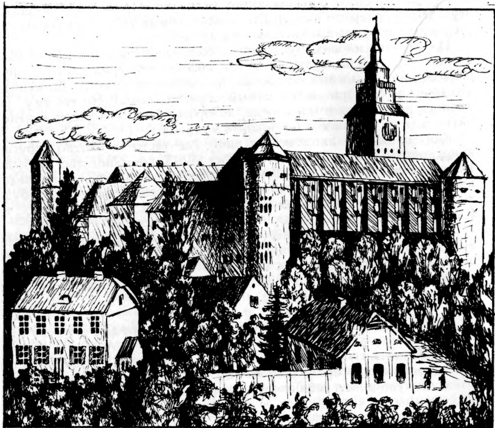
Вид на Королевский замок, слева дом Канта.

приобрел 17 ноября 1722 года еще участок в сторону Шлоссбрюкке длиной в сто футов «пустынной почвы» у замкового рва. Весь участок Персода перешел от его наследников 3 июля 1737 года за 1000 гульденов к пекарю Иоганну Кусбилю, а от него 21 февраля 1752 года за 6860 гульденов — к портретисту Иоганну Готлибу Беккеру. От Беккера, который, кстати сказать, был известным художником и написал, в частности, портрет Канта, последний и приобрел это владение с помощью Гиппеля 30 декабря 1783 года за 5500 гульденов.