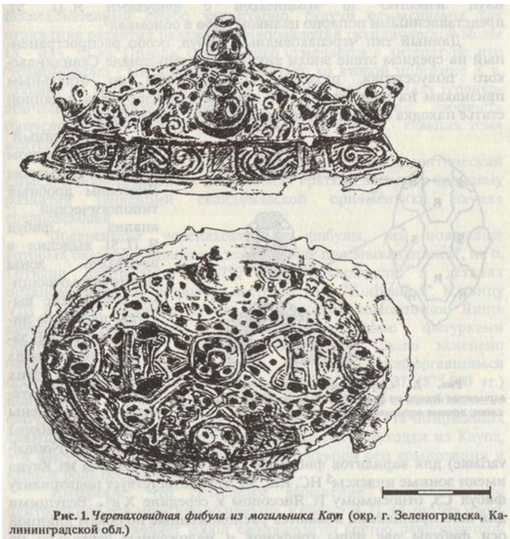
Рис. 1. Черепаховидная фибула из могильника Кауп (окр. г. Зеленоградска, Калининградской обл.)

Я. Петерсену) 1 , в целом датируемому 900-1000 гг., что для Каупа подтверждается встреченными с фибулами такого типа в комплексах остальными деталями инвентаря 2 . К настоящему времени, включая анализируемую в статье находку, на могильнике Кауп известно 10 комплексов с фибулами Я. П. 51, представленными попарно целиком либо в обломках 3 .